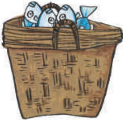
၁။ ဝါးခြင်းတောင်း

ဒါလေးတွေက ပုံပြင်ထဲမှာ ပါတဲ့ ထည့်စရာ ပစ္စည်းလေးတွေပါ။ အတူတူ ကြည့်ကြရအောင်။