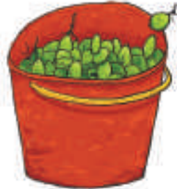
၂။ ရေပုံး