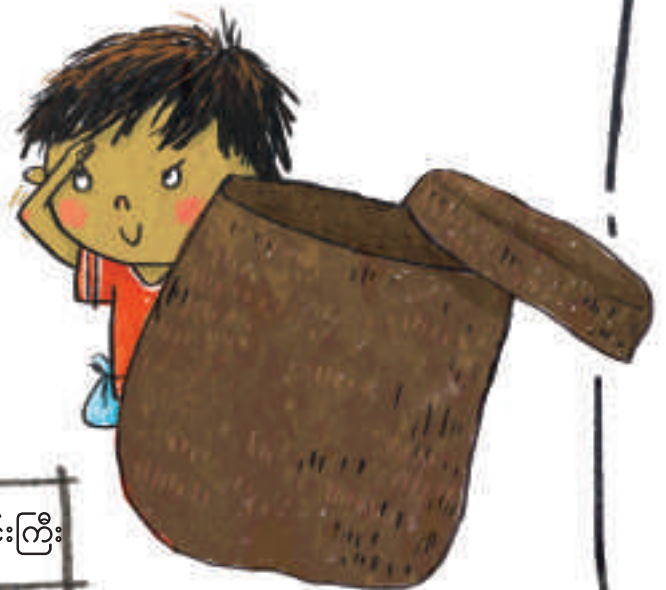
၇။ ဝါးတောင်းကြီး