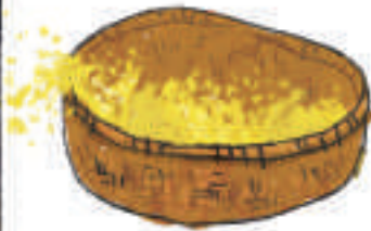
၄။ ခြင်းတောင်းလေး