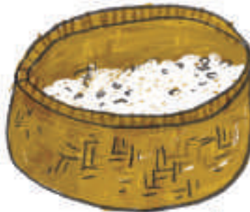
၅။ စပါးတောင်း