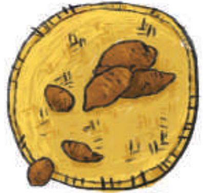
၃။ ဆန်ကော