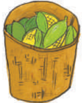
၆။ တောင်း