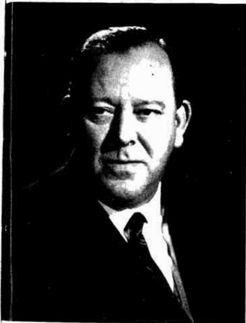
၁။ ပထမဆုံး အတွင်းရေးမှူးချုပ် ထရီဗီလီ (၁၉၄၆-၁၉၅၁)