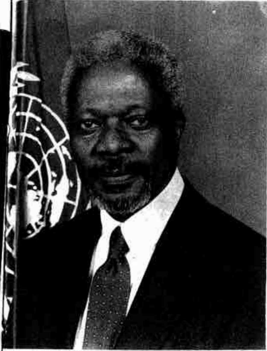
ကမ္ဘာ့ကုလသမဂ္ဂ၊ သတ္တမအကြိမ်မြောက် အထွေထွေအတွင်းရေးမှူးချုပ် “မစ္စတာကိုဖီအာနန်”။

၁၉၉၆ ခုနှစ်၊ ဒီဇင်ဘာ(၁၇)ရက်နေ့တွင် ကျင်းပသော ကုလသမဂ္ဂ အထွေထွေညီလာခံကြီးက (၅)နှစ်သက်တမ်းအတွက် ရွေးချယ်တင်မြောက် ခဲ့သည်။ ၁၉၉၅ ခုနှစ်၊ ဇန်နဝါရီလ (၁)ရက်နေ့တွင် စတင် တာဝန် ထမ်းဆောင်ခဲ့သည်။