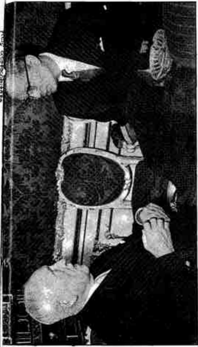
မြန်မာ့သမ္မတနိုင်ငံ သမ္မတကြီး အောင်စောလှနှင့် ဦးသန်တို့ ၁၉၆၂-ခုနှစ်၊ မတ်လတွင် (၃) ရက်နေ့က ဝီယင်မြို့တော်၌ ဆွေးနွေးကြစဉ်