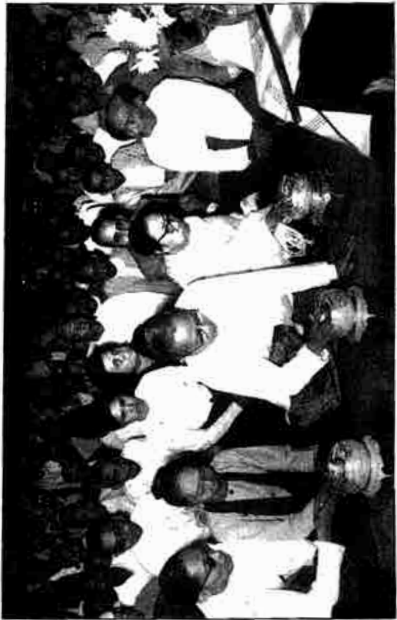
မဟာမိတ်အဖွဲ့ဝင်များသည် ဗဟိုကော်မတီဝင်များနှင့် အတူတူပင် အစည်းအဝေးတက်ရောက်ကြသည်။