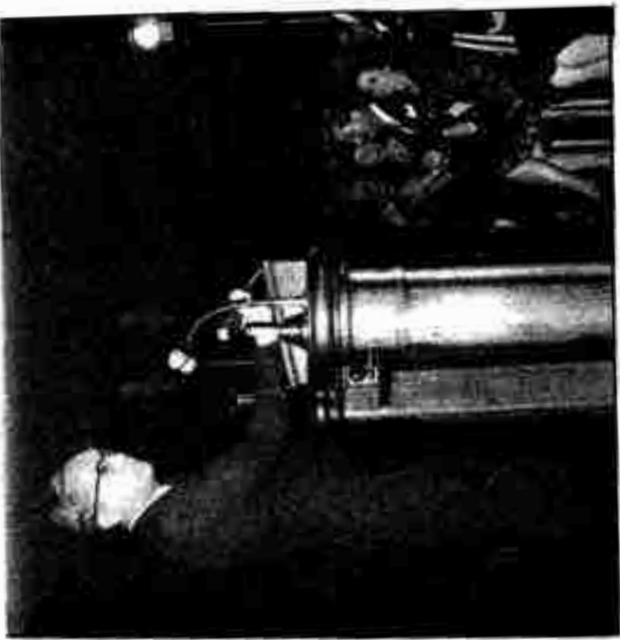
Իւրի արտաստեղծութիւնները անկարգի (a) լսող 1944-1950 ընկերակիցներու համար, 1950 թ. 12 ամիսներէն (a) փ