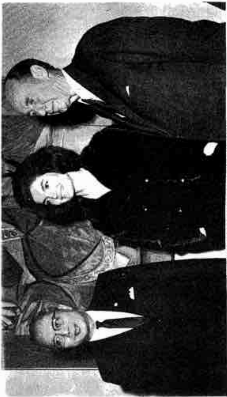
အမေရိကန်အစိုးရအဖွဲ့ဝင်များနှင့် အိန္ဒိယအစိုးရအဖွဲ့ဝင်များ အတူတူရှိနေကြစဉ် (၁၉၅၅) ခုနှစ်၊ ဇူလိုင်လလယ်ပိုင်းတွင် ရိုက်ကူးခြင်း (အိန္ဒိယ) နှင့် အိန္ဒိယအစိုးရအဖွဲ့ဝင်များ အတူတူရှိနေကြစဉ် (၁၉၅၅) ခုနှစ်၊ ဇူလိုင်လလယ်ပိုင်းတွင်