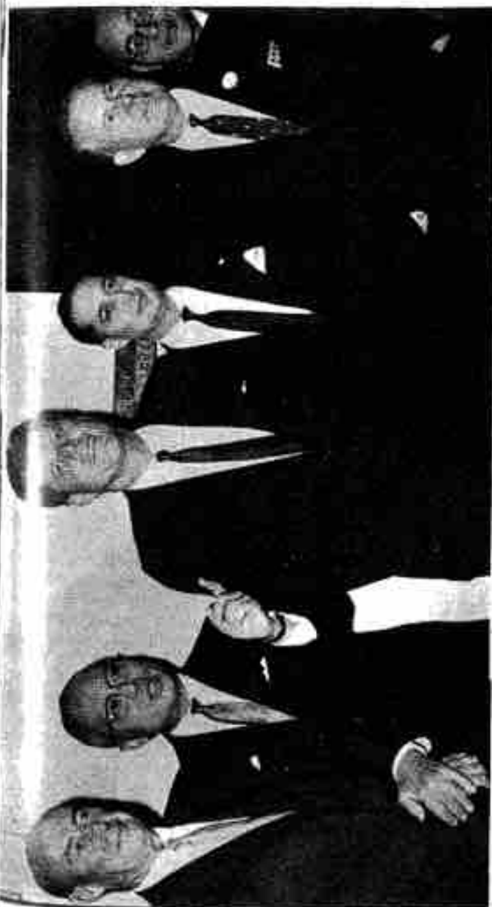
ပုံ (၆) အမေရိကန်ပြည်ထောင်စု သမ္မတကြီး ဖရန်ကလိန် ကနေဒါနှင့် ဦးထွန်း