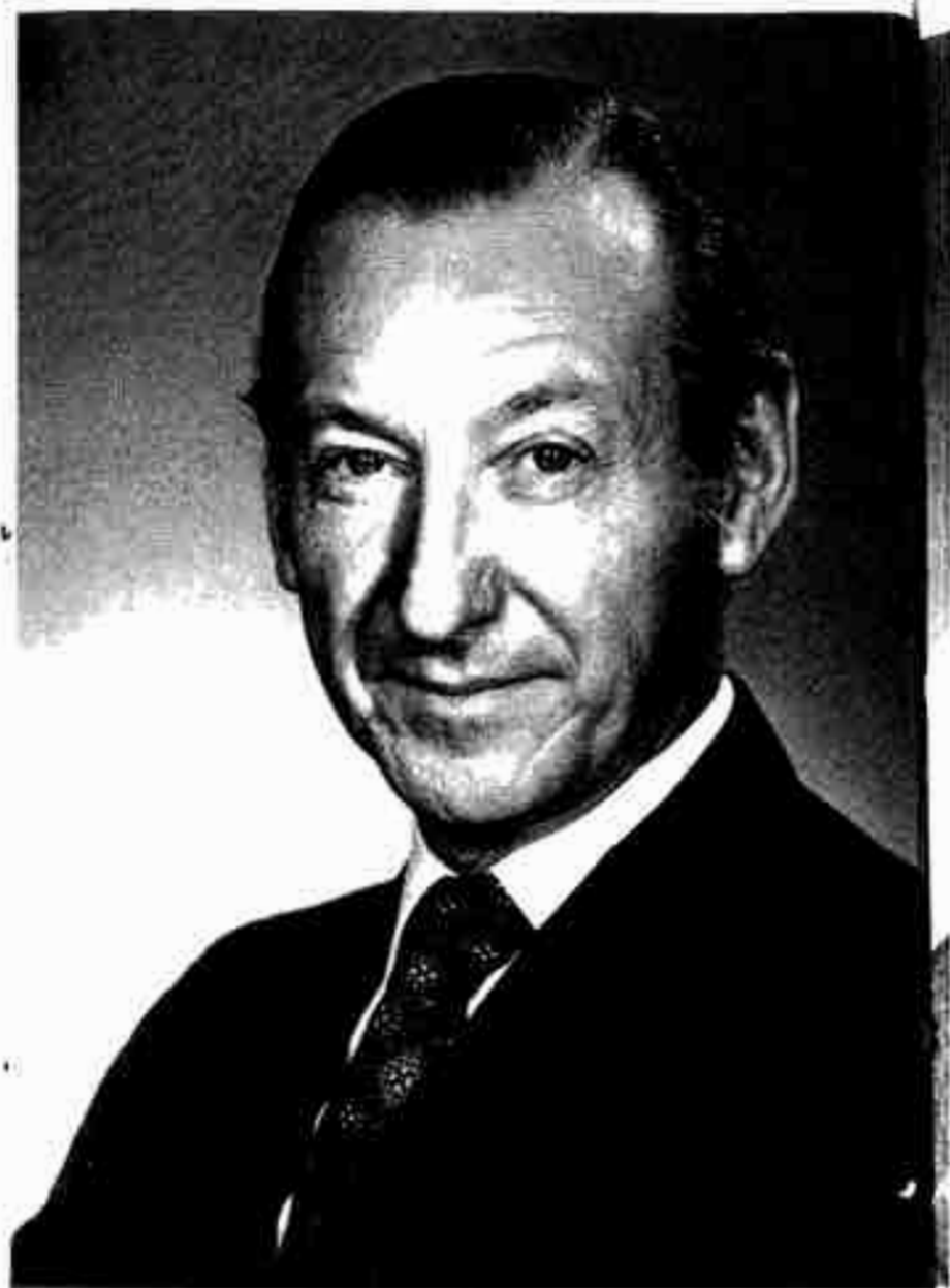
၄။ စတုတ္ထမြောက် အတွင်းရေးမှူးချုပ် ကွတ်ဝါးလ်ဟိုင်းမ် (ဩစထရီးယားနိုင်ငံ)