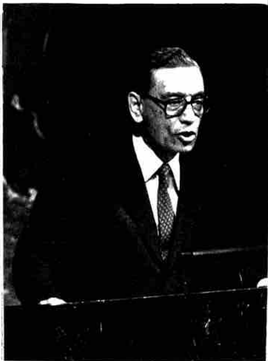
၆။ ဆဋ္ဌမမြောက် အတွင်းရေးမှူးချုပ် ဘူးထရိစ် ဘူးထရိစ်ဂါလီ (အိဂျစ်နိုင်ငံ)