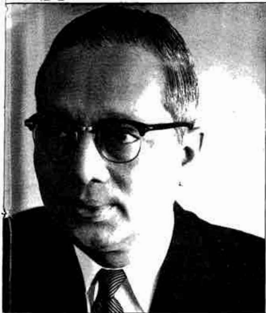
ကမ္ဘာ့ကုလသမဂ္ဂ အတွင်းရေးမှူးချုပ် ဦးသန်း (၁၉၅၉ - ၁၉၇၄)