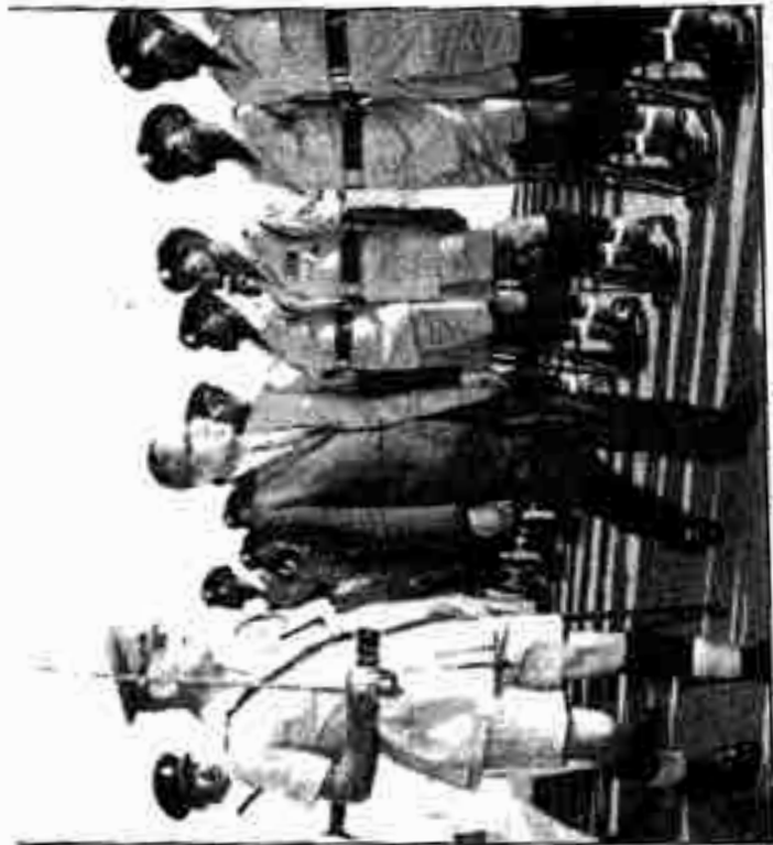
Իւրի արտաստեղծութիւնները ընկերակիցներու համար, 1950 թ. 12 ամիսներէն (a) փ