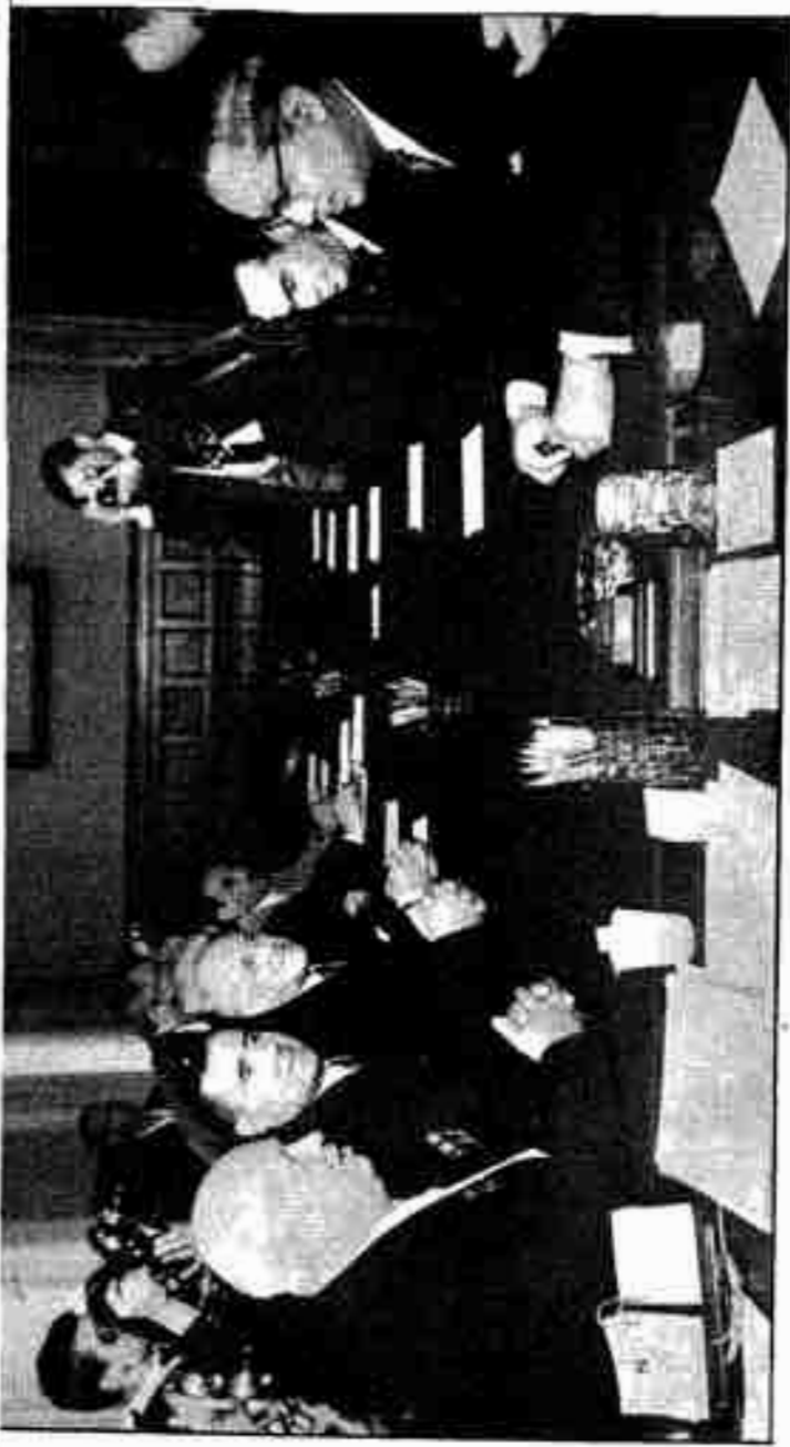
ပုံ (၁) မြန်မာနိုင်ငံတော်အစိုးရအဖွဲ့ဝင်များနှင့် ဗဟိုဘဏ်အဖွဲ့ဝင်များ အတူတူပူးပေါင်းဆွဲကြားနေကြပုံ