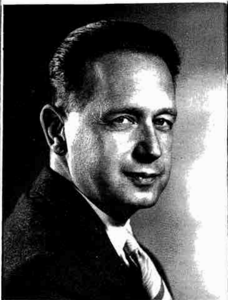
၂။ ဒုတိယမြောက် အတွင်းရေးမှူးချုပ် ခက်ဟမ်မားရှီးလ် (ဆွီဒင်နိုင်ငံ)