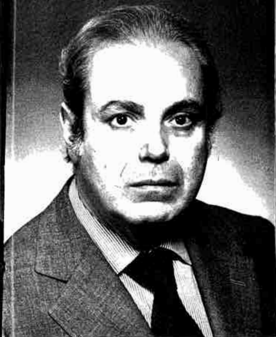
၅။ ပဉ္စမမြောက် အတွင်းရေးမှူးချုပ် ကျွဲဦးယားပဲရစ်စ် ဒေးကွေးလျား (ပီရှားနိုင်ငံ)