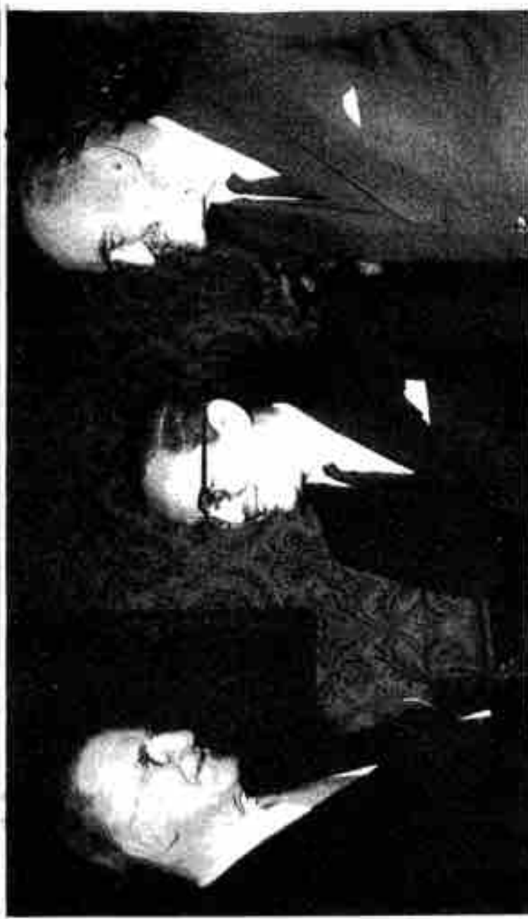
ဒုတိယမြောက် ဂျပန်နိုင်ငံ ဖခင် ငွေ-ဂ-၆-၆၆ ဌာနအဖွဲ့အစည်း ဖခင် (ဝ) ဝိသုဒ္ဓိ၊ ဖခင် (ခ) ဝိသုဒ္ဓိ၊ ဖခင် (ဂ) ဝိသုဒ္ဓိ (၆၆) ဖ